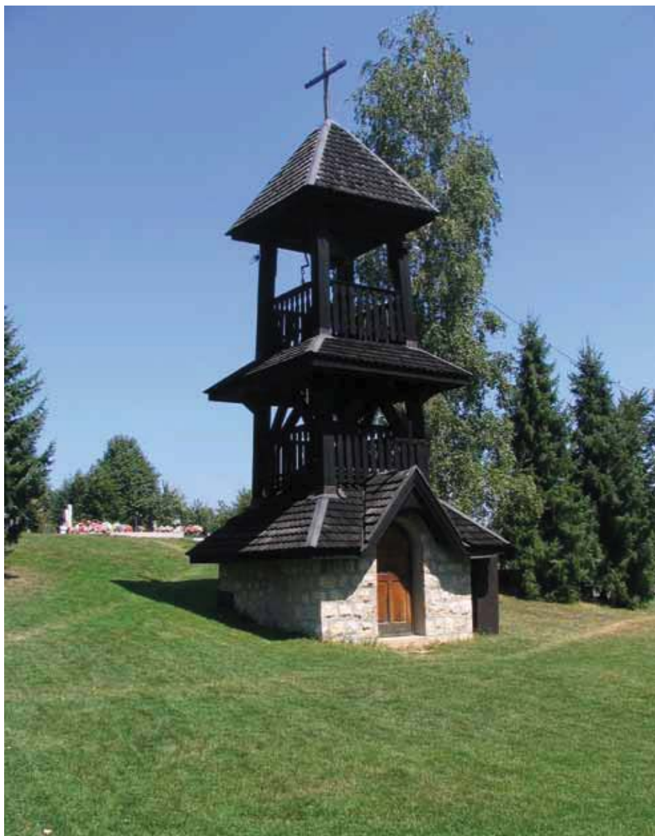
Drvena seoska crkva

davno istraživanje Instituta za društvene nauke, sprovedeno još 1977. godine, pokazalo je da poljoprivrednike odlikuje tradicionalni stil života koji karakterišu podređenost potrošnje i zadovoljavanja ličnih potreba radu (Pešić, Vesna, 1977). Autorka je utvrdila da je dokolica ovog društvenog sloja difuzna (promenljiva