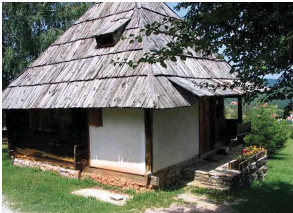
Stara kuća na Zlatiboru

Izrazita većina domaćinstava iz uzorka poseduje određenu površinu zemljišta. Ipak, 10% domaćinstava ne poseduje vlastito zemljište, već ga uglavnom uzima u zakup ili dobija na korišćenje. Među domaćinstvima koja poseduju zemljište preovlađuju ona koja imaju sitan posed i posed srednje veličine.