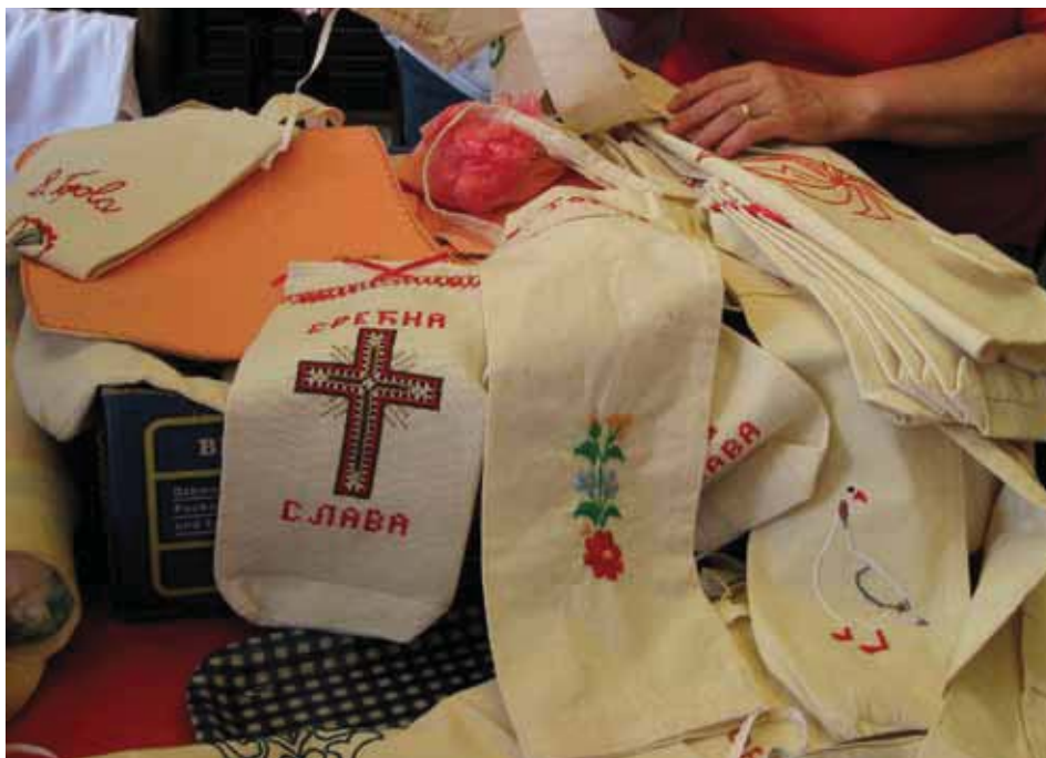
Rukotvorine žena iz Vojvodine

Žene iz uzorka pokazuju znatno veću spremnost da se uključe u zadruge nego da se upuste u samostalno preduzetništvo: 33% želelo bi da se uključi u poljoprivrednu zadrugu, dok bi 45% želelo da osnuje zadrugu sa drugim ženama iz sela. Većina ispitanica ima već i ideju čime bi takva zadruga trebalo da se bavi: u 37%