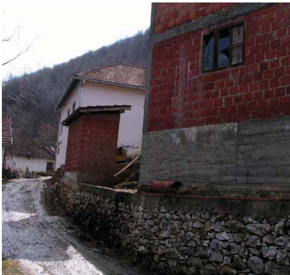
Seoski predeo Goč

Još u periodu socijalizma, poljoprivreda je bila predmet različitih strategija i mera podrške države. Finansijska politika je, međutim, bila usmerenija na državna/društvena poljoprivredna preduzeća, nego na privatna gazdinstva. Osim toga, podrška poljoprivredi bila je profilisanija u smislu podrške dohotku poljoprivrednih proizvođača. Tek se nakon 2000. država preorijentiše na podsticanje investicija na poljoprivrednim gazdinstvima. Ovo je i jedno od osnovnih usmerenja Strategije razvoja poljoprivrede usvojene 2005. godine (Bogdanov, 2007:71).