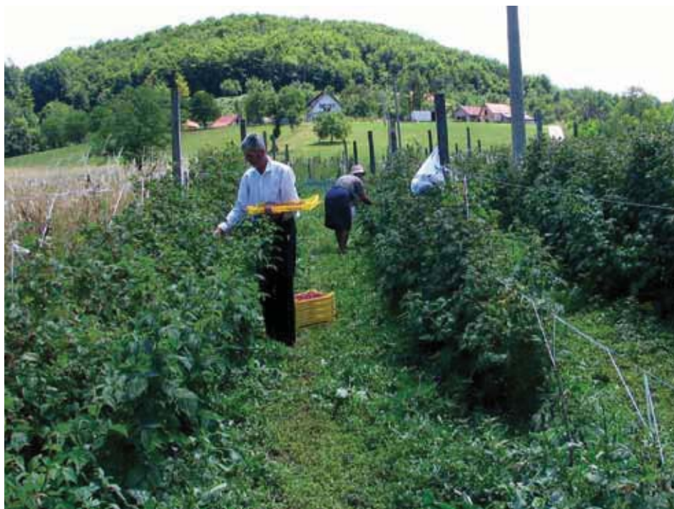
Radovi u malinjaku