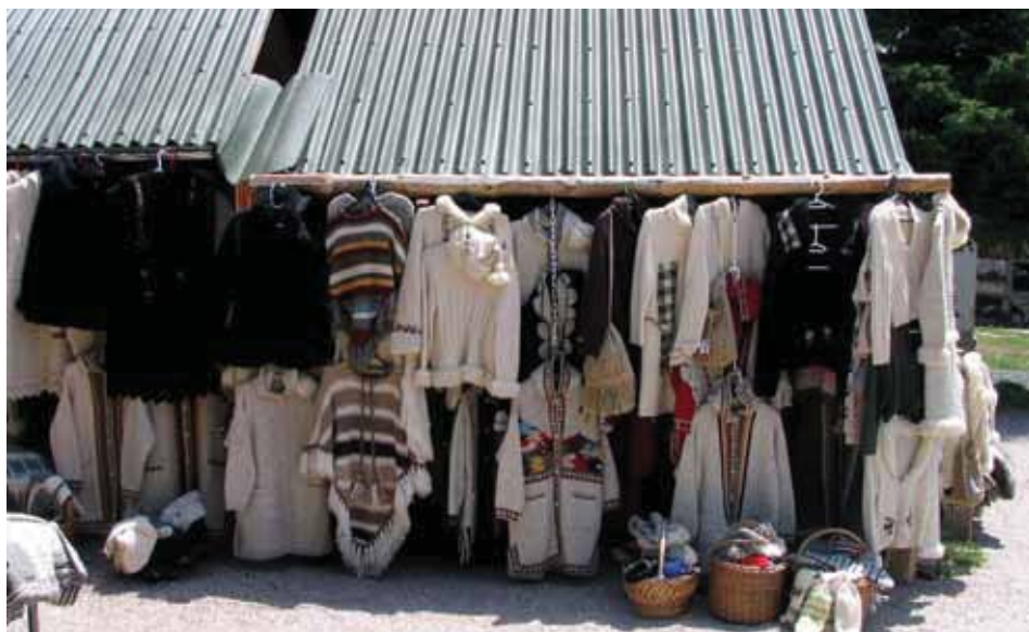
Proizvodi kućne radinosti (ručni radovi)

se da je ona značajno niža. Istraživanje Instituta za sociološka istraživanja Filozofskog fakulteta u Beogradu pokazalo je da je u uzorku opšte populacije 45% osoba spremno na samozaposlenost, a 35% na preduzetništvo (Bolčić, 2004:129). Žene su generalno manje spremne na ove oblike samostalnog posla nego muškarci. Dok je 38% žena iskazalo spremnost za samozaposlenost, istu spremnost iskazalo je 53% muškaraca. Istovremeno, 44% muškaraca iskazalo je spremnost na preduzetništvo, dok je to učinilo 30% žena na uzorku populacije Srbije (Babović, 2007:84).